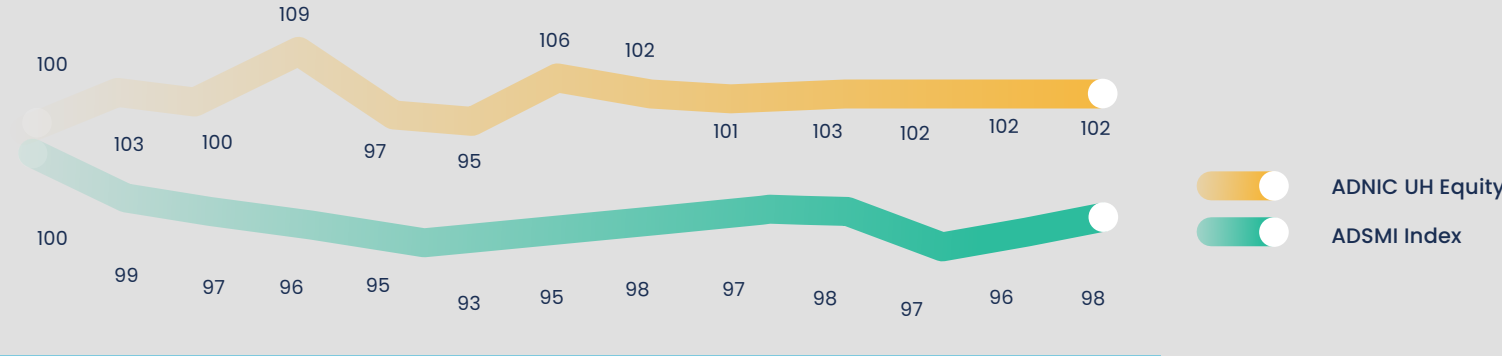
مقارنة أداء سهم الشركة مع مؤشر القطاع المالي خلال عام 2024