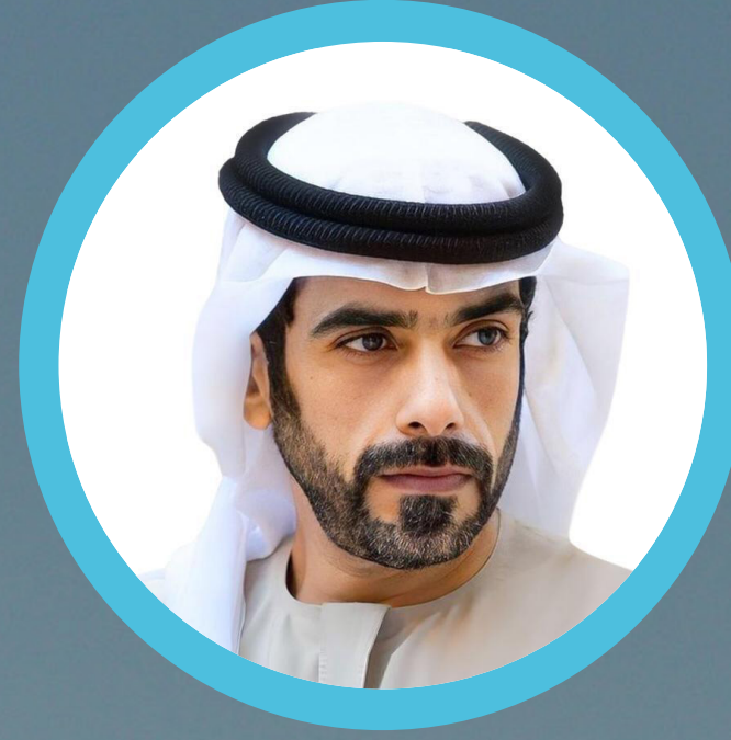
الشيخ ذياب بن طحنون آل نهيان

عضو مجلس الإدارة – عضو غير تنفيذي وغير مستقل